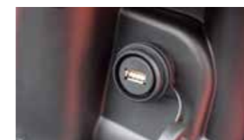
USB aansluiting in het dashboardkastje