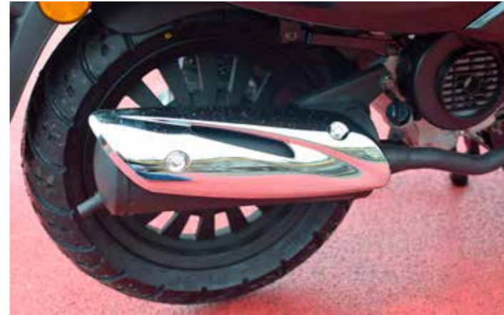
Het geluid blijft netjes op de achtergrond