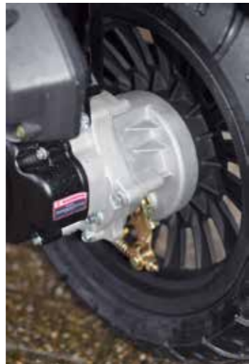
... en de trommelrem achter zijn voldoende