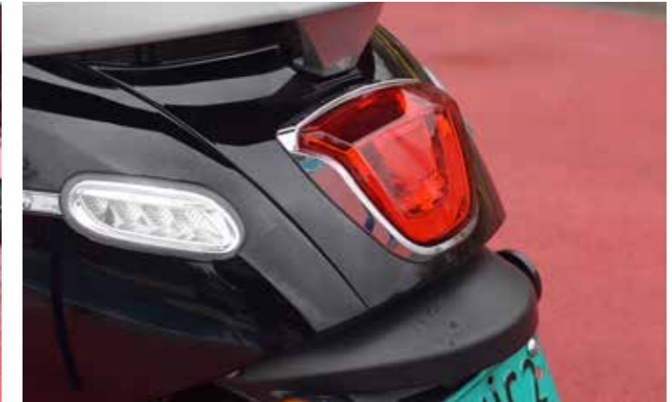
Ook de achterzijde is geslaagd!

rassend goed, het zadel is nét lang genoeg voor twee volwassenen. Zijn of haar voeten kunnen plaatsnemen op de uitklapbare stepjes, een goede houvast is er aan de standaard gemonteerde beugel boven het achterlicht.