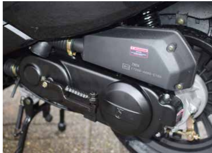
Het motorblok loopt als naaimachientje