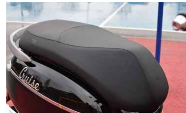
Lekker 'dik' zadel