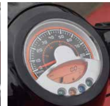
Duidelijk afleesbaar dashboard