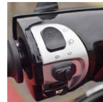
De knopjes zijn weggewerkt in de stuurkap