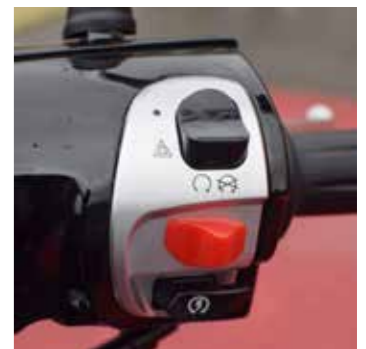
Alarmlichten, dat is handig!

kosten) snurkt hij daar met zijn prijs weldegelijk tegenaan!